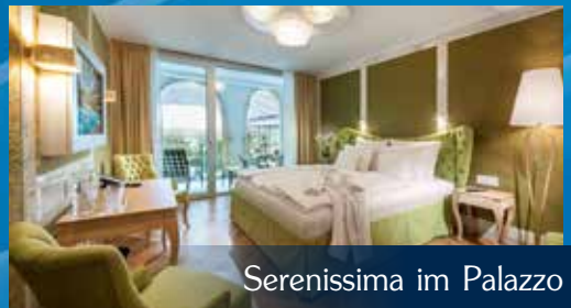
Serenissima im Palazzo