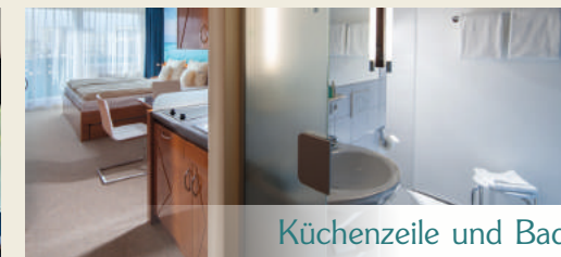
Küchenzeile und Bad