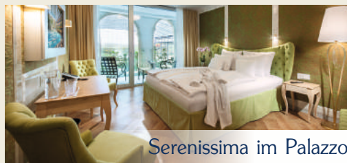
Serenissima im Palazzo